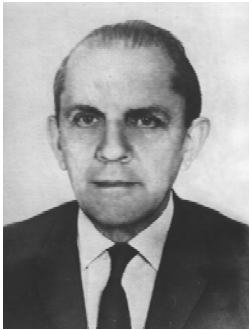
Ростислав Євгенович Кавецький