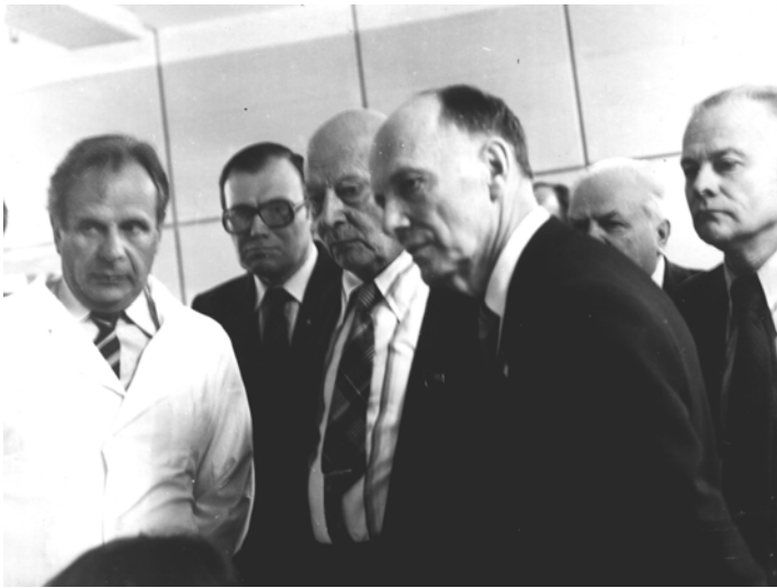
Президент АН СРСР академік А.П. Александров та президент АН УРСР академік Б.Є. Патон в Інституті фізіології ім. О.О. Богомольця АН УРСР, 1982 рік. Пояснення дає директор Інституту, академік-секретар Відділення фізіології АН СРСР академік П.Г. Костюк

Ним розроблено та застосовано методи прямого вимірювання електричної активності нервової клітини за допомогою мікроелектродів, кількісного вимірювання іонних струмів через її мембрану при фіксації напруги (монографія “Микроэлектродная техника”, 1960). Вперше у світовій науці розроблено метод внутрішньоклітинної перфузії нервових клітин, який дає змогу контролювати процеси на внутрішньому боці нейрональної мембрани. Використання цього методу стало основою широкого розгортання досліджень іонних механізмів діяльності нервових та інших збуджувальних клітин як у різних лабораторіях СРСР, так і у багатьох лабораторіях США, Японії, Німеччини й інших країн (П.Г. Костюк, О.О. Кришталь, В.І. Підоплічко).