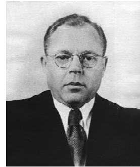
Олександр Федорович Макарченко

академік АН УРСР Олександр Федорович Макарченко (1903–1979). У цей період було створено відділи електрофізіології (завідувач – академік АН УРСР Д.С. Воронцов), загальної фізіології нервової системи (завідувач – П.Г. Костюк), біофізики (завідувач – член-кореспондент АН УРСР О.О. Городецький), вікової фізіології (завідувач – Н.В. Лауер), травлення (завідувач – М.І. Путілін). Основна увага була зосереджена на вивченні фізіологічних механізмів гіпоксії, процесів виснаження та відновлення в діяльності різних систем, впливу на організм іонізуючого випромінювання, електрофізіології нервових і м'язових клітин. Вивчалися також питання фізіології та патології кровообігу (академік АМН СРСР М.М. Горєв).