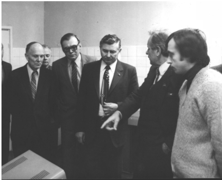
Президент АН СРСР академік Г.І. Марчук та президент АН УРСР академік Б.Є. Патон в Інституті фізіології ім. О.О. Богомольця АН УРСР, 1987 рік

Доведено, що специфічна гангліоблокуюча дія деяких