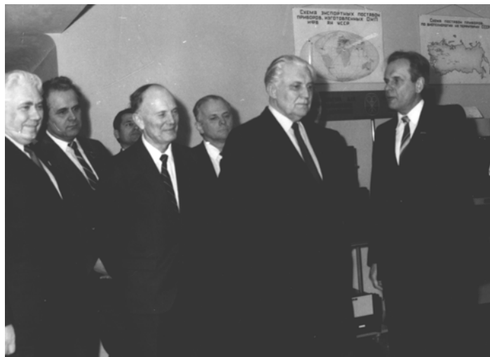
Перший секретар ЦК КП України В.В. Щербицький в Інституті фізіології ім. О.О. Богомольця АН УРСР, 1984 рік

Починаючи з 1983 р., основні дослідження відділу загальної фізіології нер-