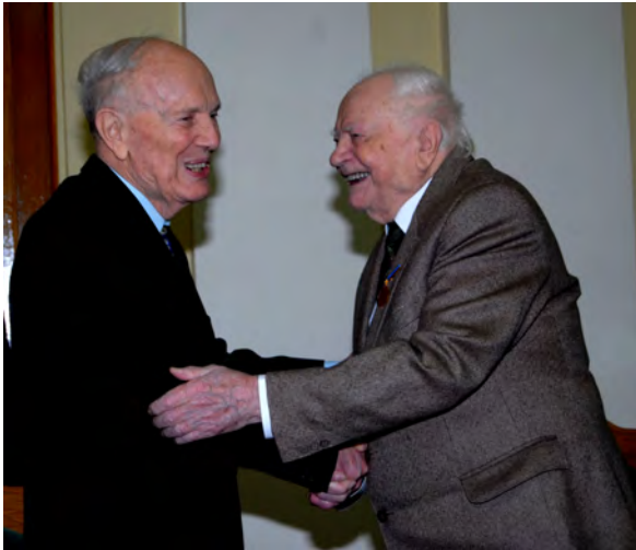
Президент НАН України академік Б.С.Патон вітає академіка НАН України П.М.Серкова з нагоди його 100-річного ювілею, 2008 рік.

фізика одиночного синапса”), О.П. Костюк та О.О. Лук’янець (2007, за монографію “Іони кальцію у функції мозку – від фізіології до патології”).