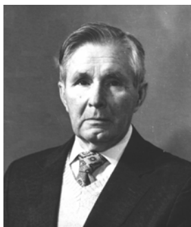
Олег Олександрович Богомолець