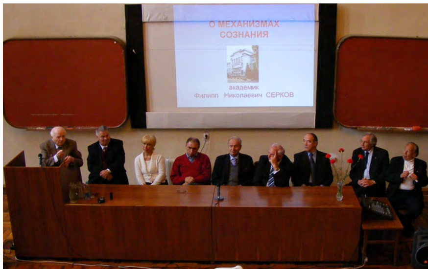
Лекція про механізми свідомості, яку читає академік НАН України Пилип Миколайович Серков в Інституті фізіології ім. О.О.Богомольця НАН України, 2008 рік.

Від часу заснування Інститут фізіології був організатором і базою для проведення найважливіших наукових форумів міжнародного, загальносоюзного та республіканського значення з нормальної та патологічної фізіології, молекулярної фізіології, нейрофізіології, нейронаук, біофізики. Серед численних конференцій, симпозіумів, з’їздів і конгресів наукових товариств можна згадати такі: конференції з алергії (1936), проблеми шоку (1937), медичної біології (1937), проблеми генезу старості і профілактики передчасного старіння організму (1938), недостатності кровообігу (1938), проблеми гіпертонії (1939), проблеми фізіологічної системи сполучної тканини (1940), фізіології та патології кровообігу (1959), всесоюзні симпозіуми “Синапти-